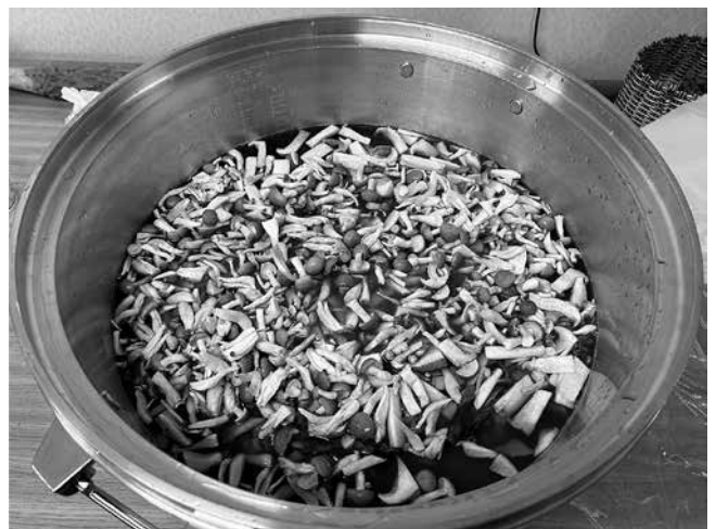
エリンギとしめじ入りさば飯