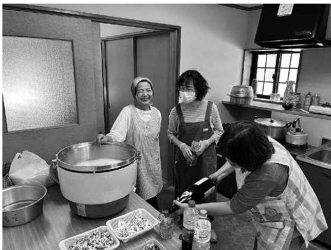
とても暑い中、準備をしていただきました