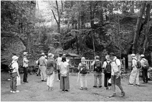
吉村寅太郎原塚にて