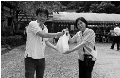
啓発物品を手渡す社会を明るくする運動実行委員会の方々