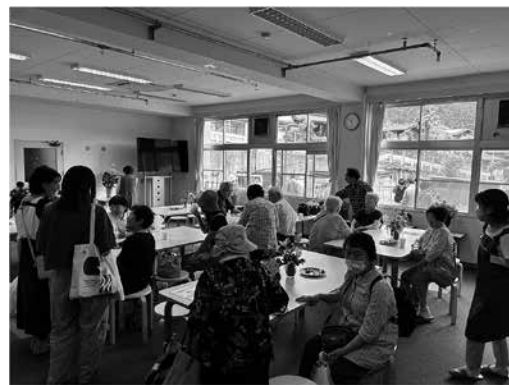
いちたつカフェ無料ドリンクスペース