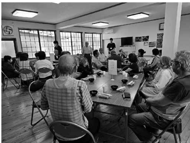
大豆生区長のご挨拶