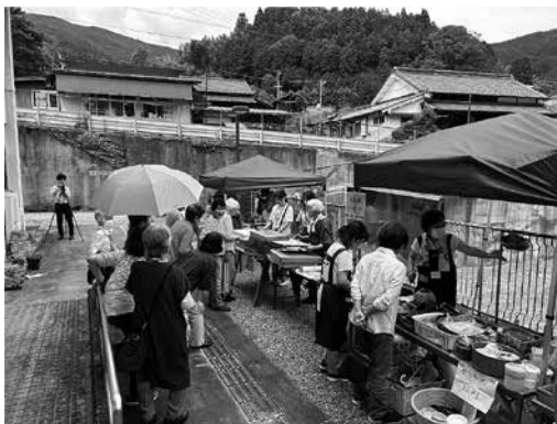
朴の葉寿司、柿の葉寿司に行列

当日来場してくれた参加者からの反響がとても大きく、『癒やされた』や『花を観ると明るくなる』などのたくさんの嬉しい意見をいただき、花を提供してくれた方からも『すごくいい企画をしてくれた』や『多くの人に見てもらおう機会を作ってくれて、ありがとう』など、次に繋がる意見をたくさん頂戴しました。