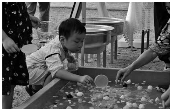
スーパーボールすくい