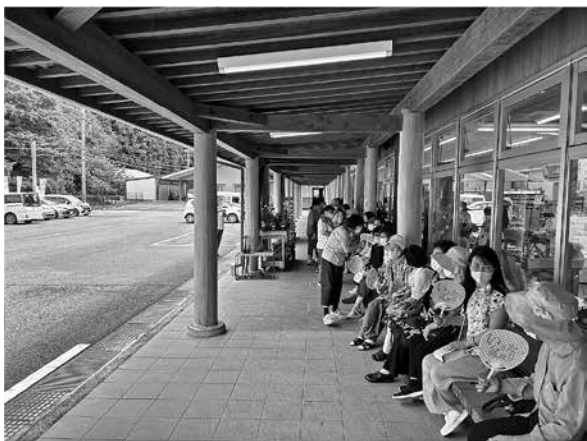
いちたつファンの長蛇の列