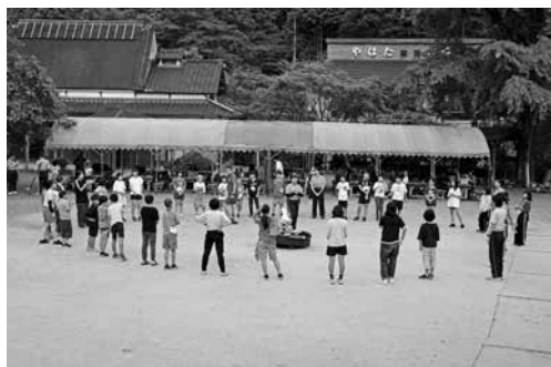
キャンプファイヤー