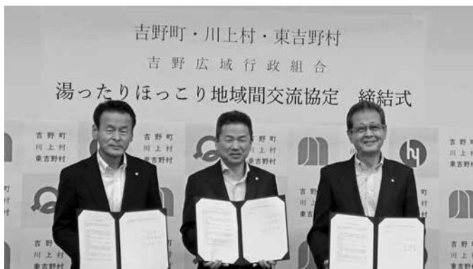
左から 泉谷村長 中井町長 水本村長