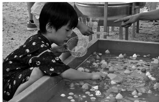
スーパーボールすくい