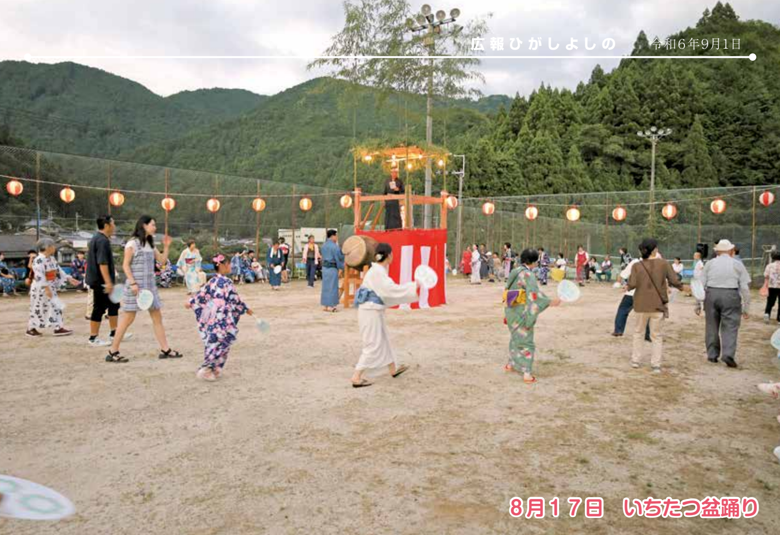
8月17日 いちたつ盆踊り