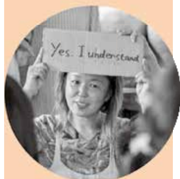
千恵先生 (TA) 英語の練習を指導して くれました。