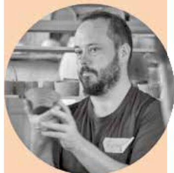
フランスス 英語で陶芸の技術を教 えています。