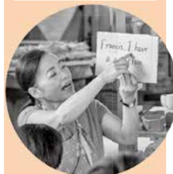
良子先生 (TA) 英語の練習を指導して くれました。