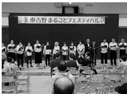
コーラスグループ「ソナレ〜奏でる〜」