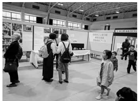
地域おこし協力隊・集落支援員コーナー