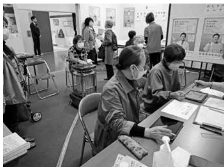
健康チェックコーナー

この他会場では、鮎の塩焼き、揚げパン、串こんにゃく、よもぎ餅、お抹茶、和菓子、たこ焼き等の模擬店、地域おこし協力隊・集落支援員コーナー、粘土細工教室、工芸教室、東吉野中学校環境グループによる古着販売コーナー、観光協定を結んだ松阪市による特産品販売コーナー、友好都市堺市から刃物や特産品の即売と、堺市公園協会のコーナー、ゆかりのまち友好市町村刈谷市からはマスコットキャラクター「かつなりくん」の缶バッジ作成体験コーナーや、天誅組コーナーへの協力も行われました。