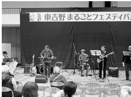
ビートルズ・カメヤのバンド