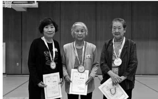
輪投げ大会1位、2位、3位の皆さん