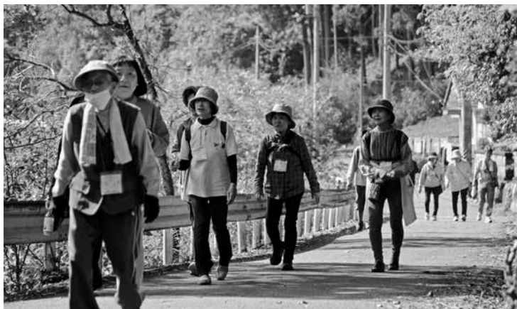
ウォーキングの様子

ゴール地点となった役場では、豪華景品が当たる抽選会が行われ、最後まで楽しめるイベントとなりました。