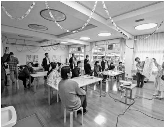
キックオフの様子