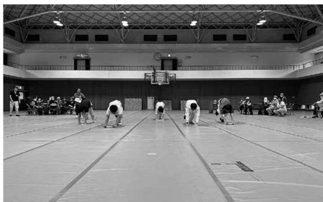
職員の本気のぞうきんがけ対決