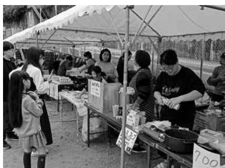
模擬店会場の様子