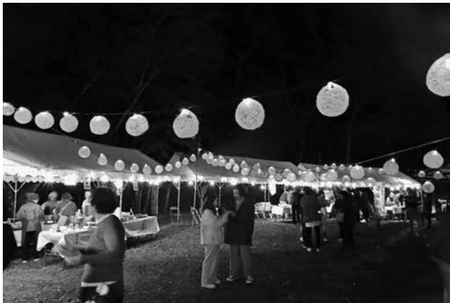
コットンボールが照らす飲食ブース