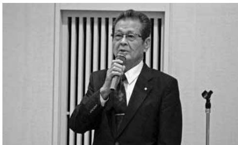
水本村長挨拶の様子