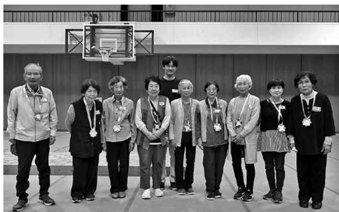
クイズで優勝した7グループの皆さん