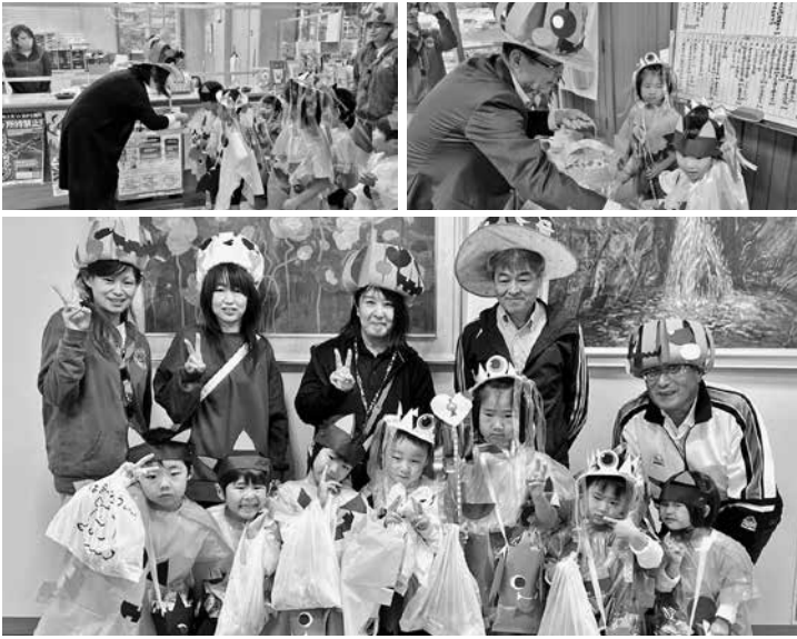
こども園ハロウィンの様子