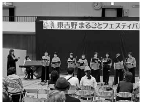
いきがい講座コーラス教室「響」