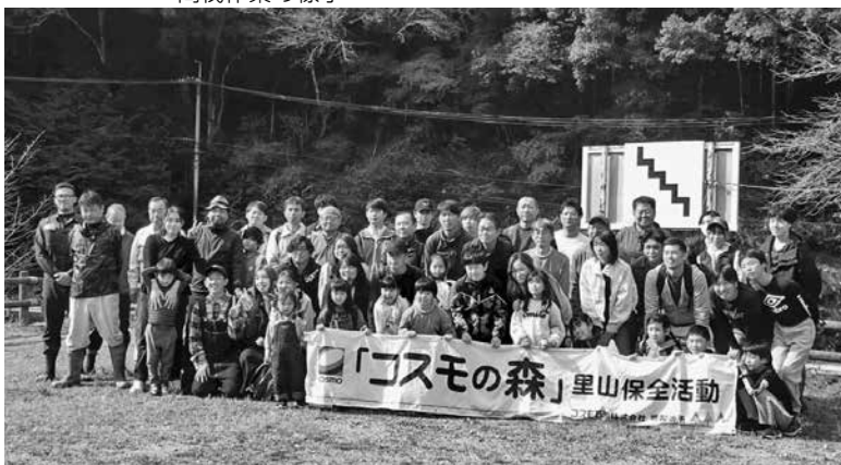
参加したコスモ石油（株）堺製油所の皆さんとその家族