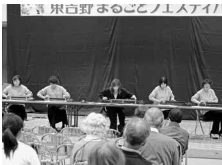
大正琴(スウィート・マミー)