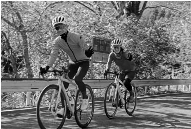
サイクリングの様子

参加された方からは「景色も空気も素晴らしかった。色々な場所で食事や買い物も楽しませていただきました。」と、ありがたい感想をいただきました。