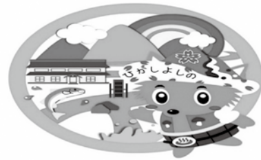
東吉野村健康づくりポイントカード