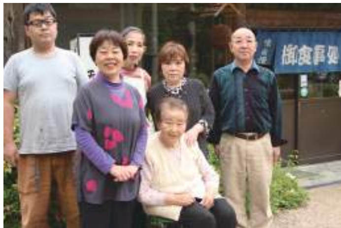
天好園スタッフの皆さん 左から二番目の方が女将さん

「天好園は、自分の田舎に帰ってきたかと思えるような場所でありたいし、ここに来て癒されてほしいと思っています」