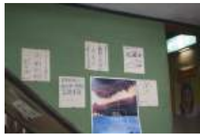
釣り名人達のサインが飾られています！