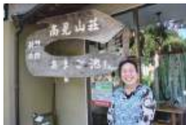
いつも明るい女将さん、大好きです！

観光料理旅館 あまご池 高見山荘 東吉野村大字杉谷45 ☎0746-44-0006 IN●午後4時 OUT●午前10時 休み：不定休 部屋：10室(他に大広間有) 駐車：50台 料金：1泊2食付 10,000円(税別)から 昼食だけの場合は2,500円(税別)から(要予約) U R L：http://www.5.kcn.ne.jp/~amagoike/