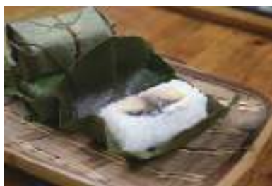
おかあちゃん特製の柿の葉寿司。