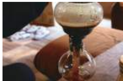
最初は、サイフォンで珈琲を頂けます。