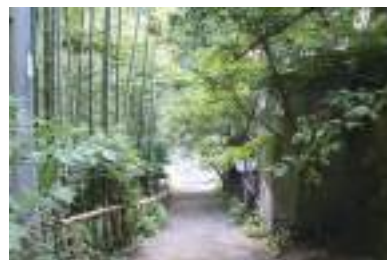
旅館から坂を下るとすぐに川へ。