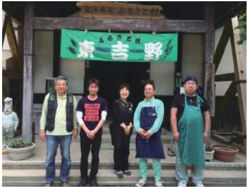
ふるさと村スタッフの皆さん。一番左が、ふるさと村館長さん。

「嬉しいことに、川遊びやキャンプ、バーベキューを楽しむファミリーから、少年野球やサッカーの合宿、大学生の研修など、幅広い方にご利用いただいております。他にも、新緑を撮影するカメラマン。高見山や明神平、薊岳、大台ヶ原などの登山客もおられます」