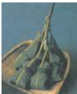
ほうの葉に包まれたアン入り団子でんがら。