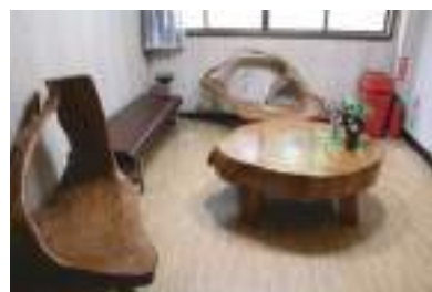
岩を抱いた木から作った珍しい椅子。

民宿ますもと 東吉野村大字小栗栖62-1 ☎ 0746-42-0145 IN●午後3時 OUT●午前10時 休み：不定休 部屋：8室 駐車：20台 料金：1泊2食付 7,500円(税込)から URL： http://www.takamigawa.com/