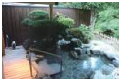
川を見おろせる露天風呂。