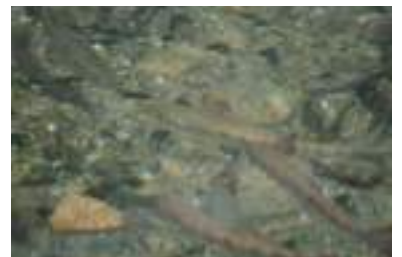
池のなかで生き活きと泳ぐアマゴ。