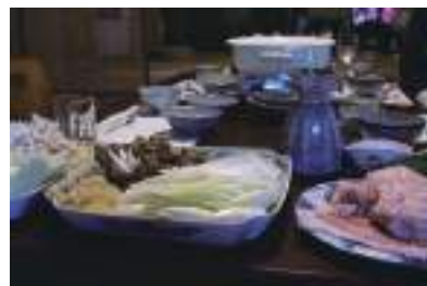
塩、ゴマだれ、梅など5種類の味で召上れ！