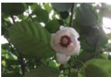
6月中が見ごろのオオヤマレンゲ