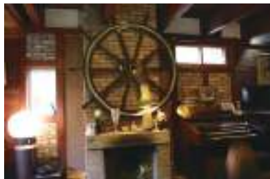
暖炉のあるオシャレな洋館。