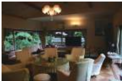
レセプションルームがまた豪華！