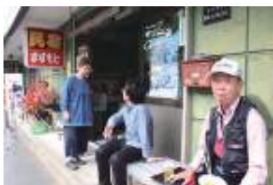
撮影日(平日)にも常連の釣り人さんが！

鮎のことを熱く語る女将さん。民宿ますもとは、そんな鮎の釜めしや、鮎のコース料理などを頂けます。