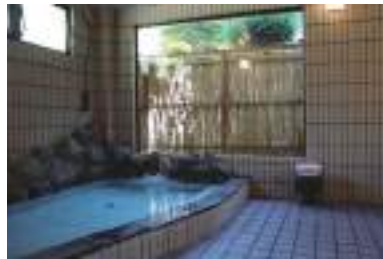
綺麗で広々としたお風呂。