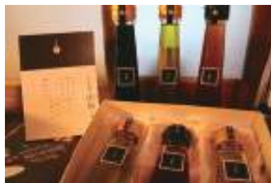
珍しい燻製オリーブオイルや醤油。