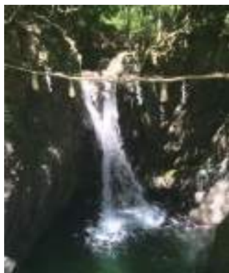
神秘的な雰囲気のある(ひむかし)の滝。