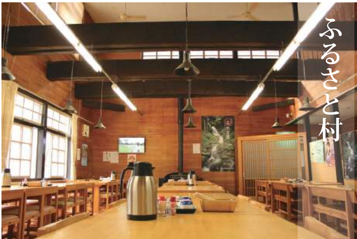
築百年の小学校を改装したふるさと村にある食堂「いちえ」。季節のお料理や懐かしの学校給食(5名様以上・要予約)もいただけます。