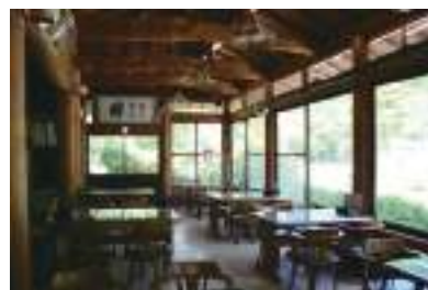
食事だけでもOK。オススメはキジ肉うどん。