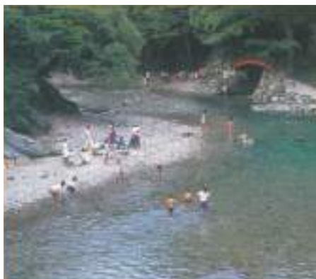
神武天皇が大和の戦勝を占った夢淵。